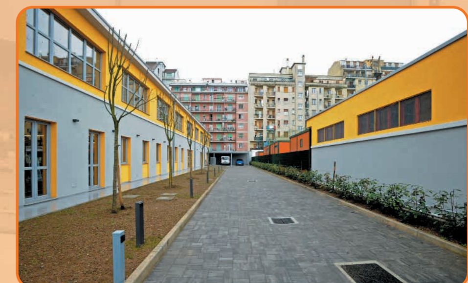
Spazio esterno attiguo piantumato utilizzabile.

Un luogo adatto a mostre, convegni, proiezioni, cene sociali, workshop, congressi, concerti, assemblee e riunioni anche facilitate, installazioni, eventi di formazione aziendale, presentazione di nuovi prodotti.